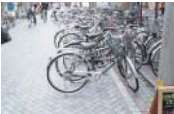
道路を狭め迷惑に

区内の各駅周辺には、通勤・通学や買い物などのため、多くの自転車が集中しています。自転車は大変便利な乗り物ですが、ひとたび路上や駅前広場などに放置されると、歩行者や車両通行の障害となり、救急・消防活動に支障を来すなど、市民生活にさまざまな問題を引き起こします。