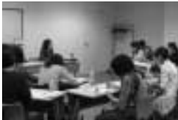
保健師による講座も

子育てに不安や悩みはつきものです。そんな子育て中の子どもと保護者の現状を理解しながら、地域の子育て支援について学びます。