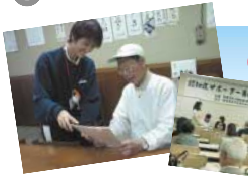
左:地域包括支援センターが個人商店に見守りを依頼 右:養成講座では寸劇を通して対応を学びます