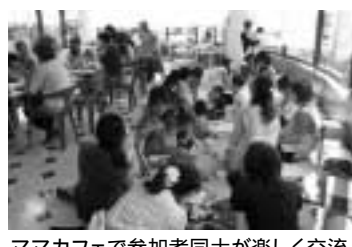
ママカフェで参加者同士が楽しく交流

写真、漫画などのアートから川崎の歴史まで、展示や講座などが楽しめる市民ミュージアム。乳幼児とその保護者世代にも文化芸術に触れてもらうため「子育て支援事業」を行っています。