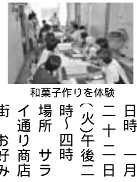
和菓子作りを体験

焼 伊鈴(今井南町418) 定員 二十人 費用 八百円 開園十二月十七日午前九時から電話で区役所地域振興課 ☎(744)3160、FAX(744)3346。「先着順」