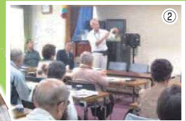
写真①大西学園吹奏楽部の協力によるキャンペーン(こすぎコアパーク) 写真②防犯教室で振り込め詐欺の被害防止法を紹介しています 写真③防犯教室での配布資料