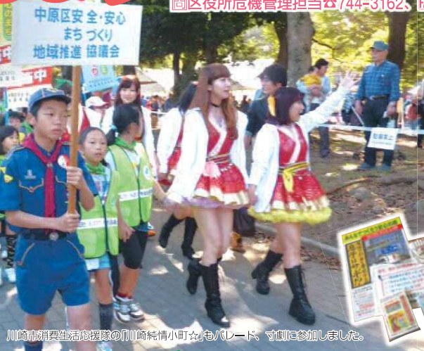
川崎市消費生活応援隊の川崎純情小町交響隊、寸劇に参加しました。

協議会では啓発活動や自主防犯活動の支援をしています。10月のなかはらゆめ区民祭では警察署とも連携し、防犯キャンペーンのパレードや寸劇などで安全・安心なまちづくりを呼び掛けました。