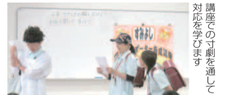
講座での寸劇を通して対応を学びます

学生にも授業で正しい理解と知識を身に付けてもらうようと、出前講座を行っています。 ☎区役所高齢・障害課 ☎744-3217、FAX 744-3345