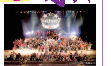
ことしも熱い舞台をお見せします

区内で活動するアマチュアミュージシャン・ダンスチームが出演する、区民手作りの音楽、ダンスの祭典です。 日時 3月8日(日)13時～19時15分 会場 総合福祉センター(エポックなかはら) ☎区役所地域振興課 ☎744-3324、FAX 744-3346