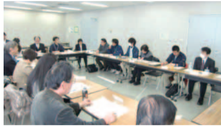
高齢者のためにできることを検討しています。

区では高齢者の皆さんが地域で安心して暮らせるように、町会・自治会、民生委員児童委員、社会福祉協議会、医療・介護関係機関、ボランティア団体、各地域包括支