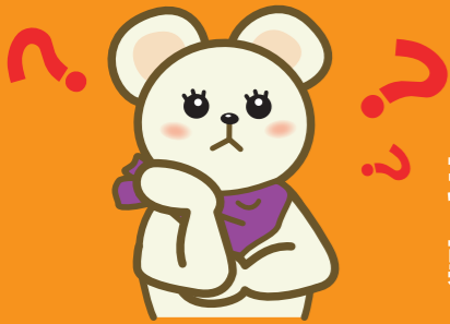
白くまのロージーちゃん (中原区の環境推進キャラクター)