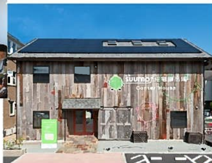
今井上町 スーモ住宅展示場内に開設したママカフェ