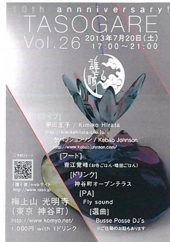
音楽会のポスター