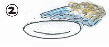
お皿に敷けば 水洗い不要!!