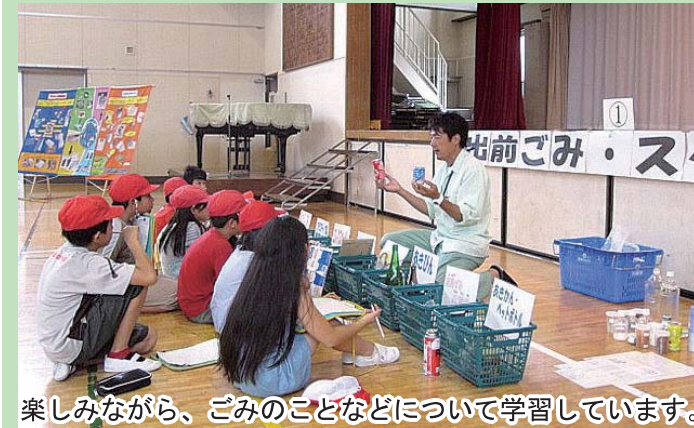
楽しみながら、ごみのことなどについて学習しています。

大人も子どもも一緒に取り組み、正しいごみの分別の理解を広げるゲームについて、検討を進めています。区内イベントや環境教育の場で活用できる、中原区らしいものを目指します。写真（左）は、現在、中原生活環境事業所が区内小学校で行っているごみの分別学習の様子です。