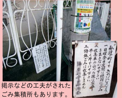
掲示などの工夫がされたごみ集積所もあります。

「きれいなまちづくり」看板などの啓発物の作成を検討しています。例えば区内のきれいな場所や区民に親しまれている場所をこれからも守っていけるように、また地域の課題箇所で改善を呼びかけるために、との思いからの提案です。デザインや掲載内容は、「公募にする」「キャラクターやフロンターレの選手を起用する」など、アピール力の高いものを目指して、アイデアを出し合っています。