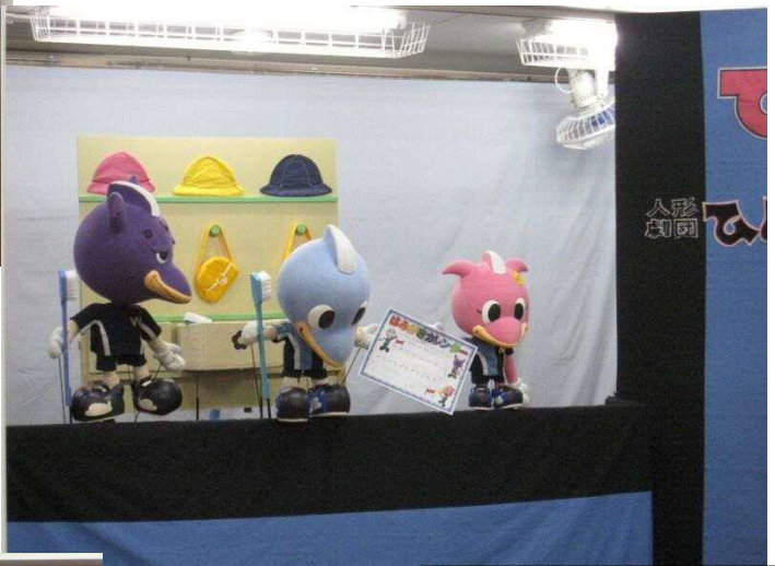
キャラクターの人形を活用