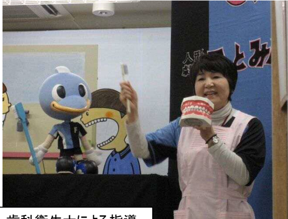
歯科衛生士による指導

【概要】川崎フロンターレのチームマスコット「ふろん太くん」の人形や同チームの応援歌の替え歌などを活用した人形劇で、区内公立保育園における歯磨き指導を実施。