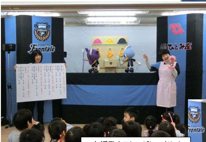
応援歌をアレンジして楽しく