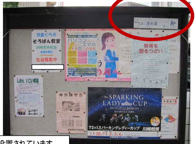
町内会の掲示板に設置されています。