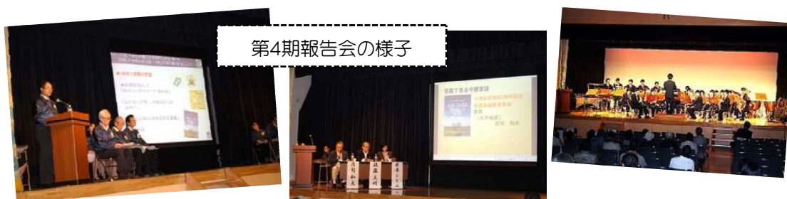
第4期報告会の様子