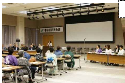
第2期報告会の様子