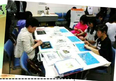
第3期報告会の様子