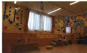
【ランチルーム&ボルダリング】