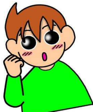
寝る・就寝・泊まる

両手をパーにして前にむけ、目の前で交差させるように弧を描いて引き寄せます。あたりがだんだんと暗くなっていく様子からだそうです。