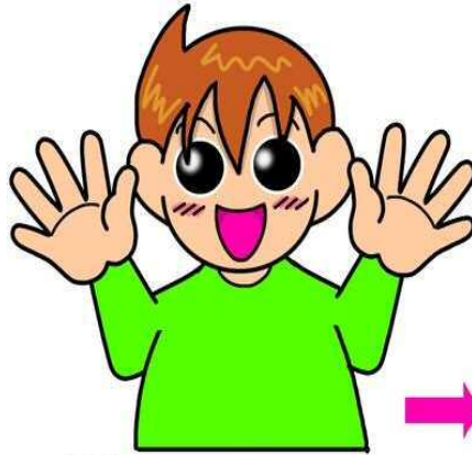
暗い・夜・こんばんは

両手をパーにして前にむけ、目の前で交差させるように弧を描いて引き寄せます。あたりがだんだんと暗くなっていく様子からだそうです。