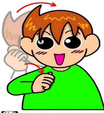
朝・起きる・起床・おはよう

胸の前で両手の人差し指を立てて向かい合わせて同時に曲げます。人と人が挨拶している状態を表しています。