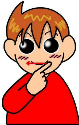
赤・赤色・紅・紅色