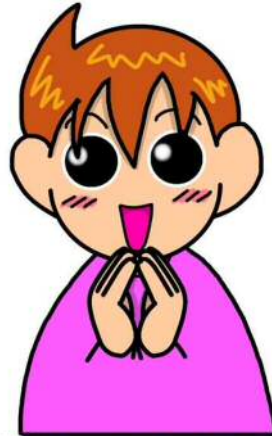
ピンク・桃・ピンク色・桃色