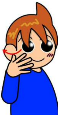
青・青色・蒼・碧