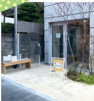
アットホームで話しやすい雰囲気