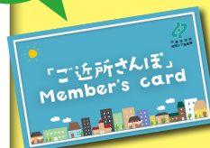
メンバーズカード