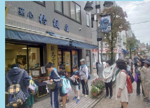
老舗の和菓子屋さんを調査！