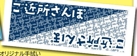
オリジナル手拭い

今、次の方法で「どう?ご近所さんぽ」を見た!とお伝えいただけるとオリジナルグッズをプレゼントします!(先着順。なくなり次第終了)