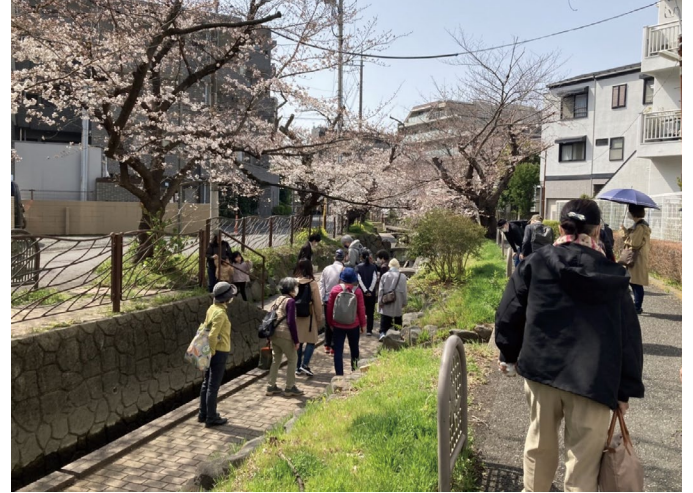
ゆるいつながりの場にも

色々な活動と相性もいいのも「ご近所さんぽ」のいいところです。ちょっと歩いてあのイベントに行ってみようとか、教室に通うのに一駅だけ歩いてみようなど、生活の中で自然に取り入れることもできるんです。