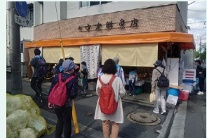
住宅街に現れる魚屋

小学生たちが丸子周辺の気になるスポットを調査する「大好き！丸子調査隊」。今回はご近所さんぽとコラボでの調査！