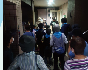
地下のフラメンコ教室に潜入