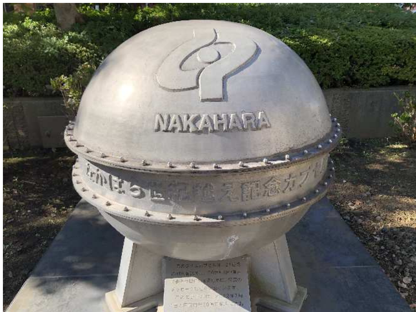
区役所敷地に設置された「なかはら世紀越えカプセル」