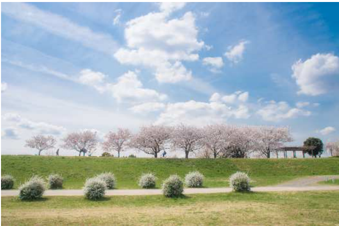
【春が来た♪】かわさき多摩川ふれあいロード

中原区は多摩川や二ヶ領用水、等々力緑地など、多くの魅力であふれています。下の画像は、過去の「なからはらフォトコンテスト」の入選作品です。