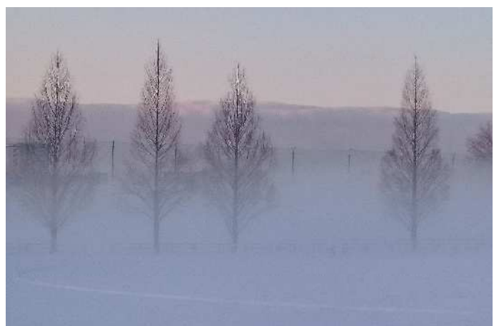
【わくわく雪景色】等々力緑地