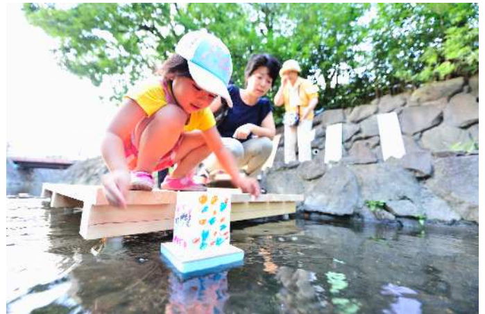
【二ヶ領用水で夏の思い出、灯籠流し】二ヶ領用水