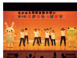
「なかはらっぱ祭り」 日頃の活動を発表します