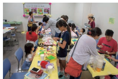
なかはらっぱ祭り

登録団体の情報が載っている冊子「なかはらっぱの仲間たち」は、区役所ほかで配布中です。