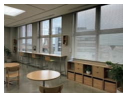
誰でも利用できるフリースペース 打ち合わせに便利