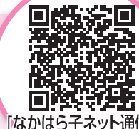
「なかはら子ネット通信」

「今日どこにお出かけしようかなあ…」そんな時は、中原区内の子育て施設のイベントカレンダーが便利です。