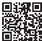
A: 「(公財)シルバー人材センターHP」 P22

出産・病気、外出時の預かりやお子さんの保育所・幼稚園・小学校への送迎などをシルバー会員がサポートいたします。