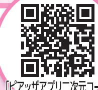
「ピアッツァアプリ二次元コード」