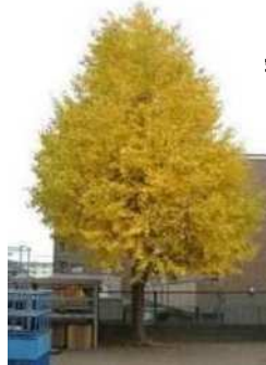
季節を感じるシンボルツリー