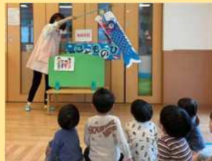
こどもの日の集い