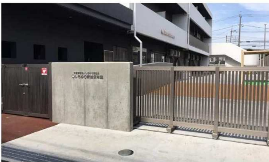
<しらゆり新城保育園 正面玄関>