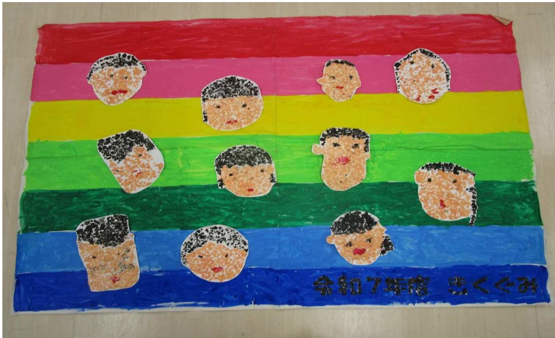
【卵の殻を使い自分たちの顔をモザイクアートで表現しました】