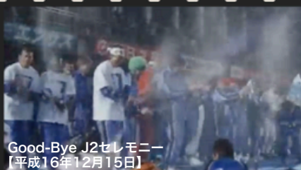
Good-Bye J2セレモニー 【平成16年12月15日】