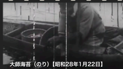
大師海苔（のり）【昭和28年1月22日】