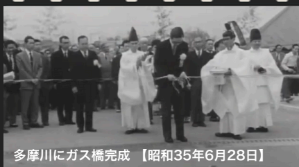
多摩川にガス橋完成【昭和35年6月28日】