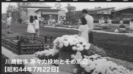
川崎散歩 等々力緑地とその周辺 【昭和44年7月22日】