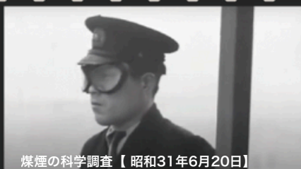
煤煙の科学調査【昭和31年6月20日】