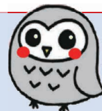
川崎市風しん対策キャラクター まえにさん