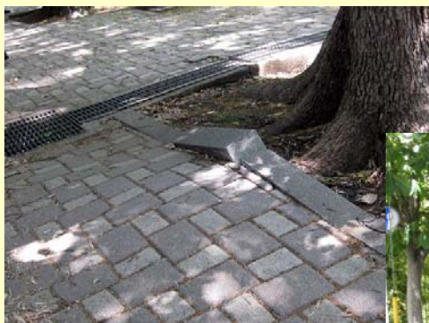
老朽化・未整備な 箇所も