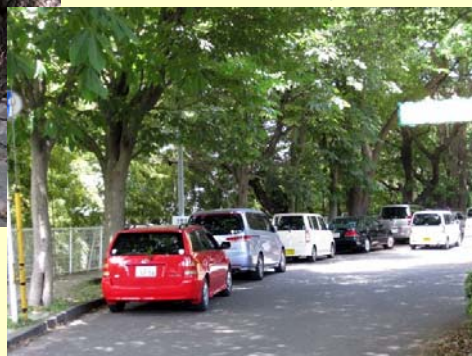
混雑時は路上駐車