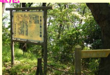
↑加瀬山古墳群 など歴史を身近 に感じられる