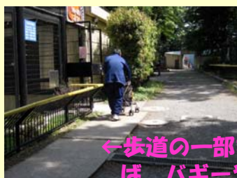
←歩道の一部を舗装すれば、バギーや車イスも スイスイ