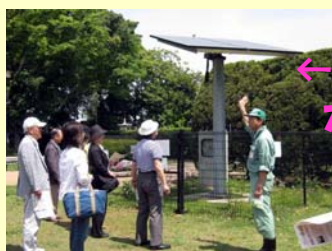
←市内唯一太陽を向く 太陽電池