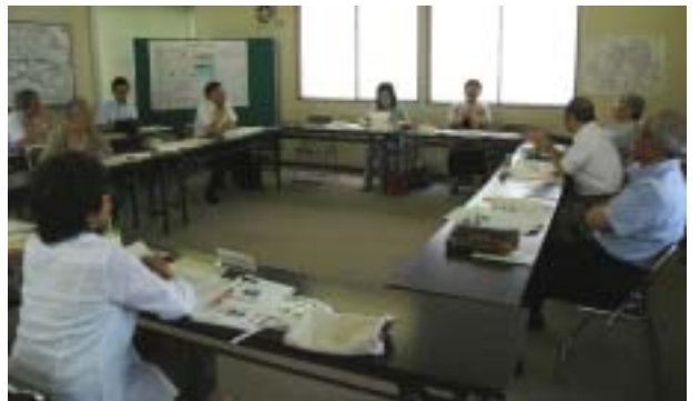
第4回子育て・環境・魅力づくり部会の様子

開催日時 12月10日(木) 午後6時30分～ 場 所 幸区役所5階第1会議室 内 容 「地域防犯活動の推進」について 「地域コミュニティ活動の推進」について