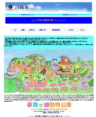
川崎市ホームページ