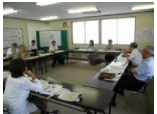
夢見ヶ崎周辺の現状と課題について多くの意見が出されました。