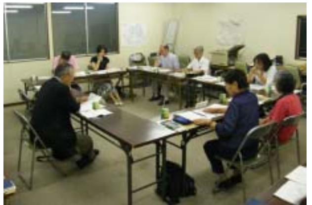
第4回安全・安心・生きがい部会の様子

開催日時 11月6日(金) 午前9時30分～ 場 所 幸区役所プレハブ2階会議室 内 容 「地域コミュニティ活動の推進」について