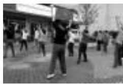
健康のために始めよう 課 48、(FAX) 6659