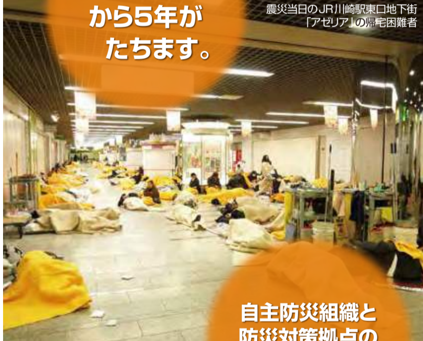
震災当日のJR川崎駅東口地下街「アゼリア」の帰宅困難者