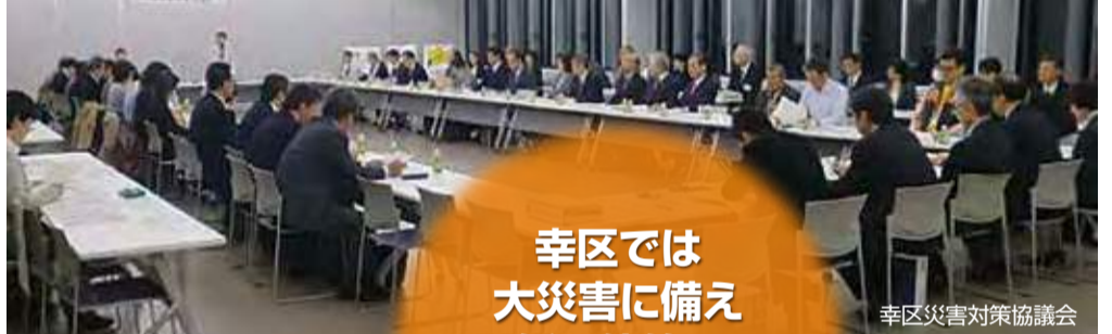
幸区災害対策協議会