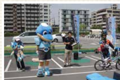
自転車ルール順守の呼びかけ(川崎フロンターレとの連携)