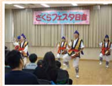
楽しいイベントが盛りだくさん