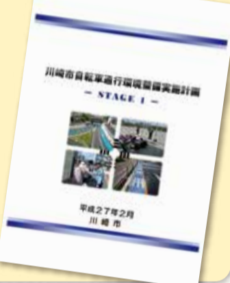
自転車通行環境整備実施計画

事故発生箇所の調査では、委員の皆さんと一緒に現場を回り、たくさんの発見をしました。市では「自転車通行環境整備実施計画」に基づいて、自転車通行環境の改善を図っていますが、提言を踏まえて、さらに整備を推進していきます。