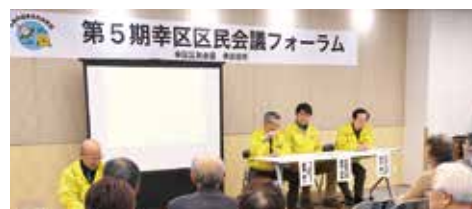
第5期幸区区民会議フォーラム

2月20日(土)に、区役所でフォーラムを開催し、提言の内容を発表しました。会場の皆さんとの活発な意見交換などもあり、有意義な一日となりました。