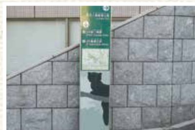
夢見ヶ崎公園への案内サインの設置