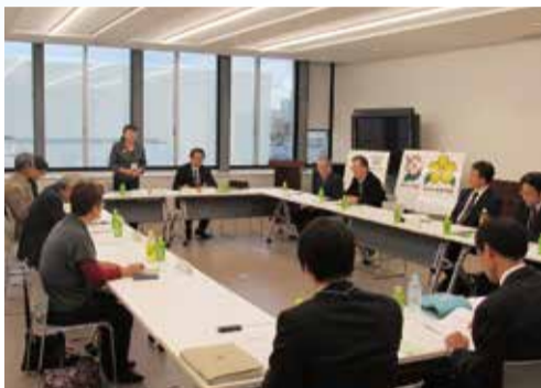
さまざまな意見が出てきます

地元の町内会や老人クラブ、子ども会、企業、観光協会、区役所職員等がメンバーとなっている「御幸公園梅香事業推進会議」を立ち上げ、今後の取組の内容について検討を進めています。