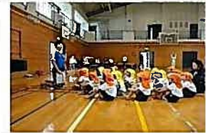
▲教諭と保育士が連携して行う事業