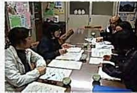
▲小学校と保育所の連絡会