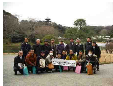
梅林視察開催状況