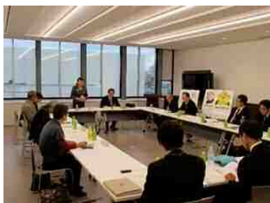
推進会議開催状況