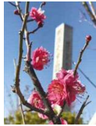
平成31年度 幸区長賞作品 「今年も春一番のり」

梅の花や果実、梅林、梅にちなんだ祭りの風景など、梅に関する写真を募集します。撮影場所は問いません。応募作品は、4~5月に区役所・日吉出張所で展示予定。なお、優秀作品は表彰します。区内で撮影された作品が優秀作品に選ばれた場合は、3月発行の「さいわいガイドマップ」表紙に掲載します。