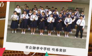
市立御幸中学校 吹奏楽部

音楽大好き!吹奏楽大好き!の個性豊かな1・2年生のメンバーで演奏します。御幸中らしいバウフルな演奏と笑顔と幸せもお届けできるように生懸命頑張ります。