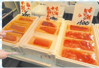
脂の乗った本マグロ