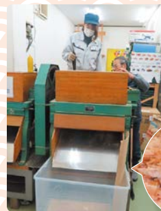
削りたての かつお節

関連棟には、肉や野菜、酒などの食品類や、調理道具、業務用調味料など、さまざまな専門店があります。お店によっては特売日やサービスデーを開催しているところもあるので要チェックです。