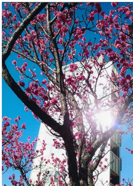
「タワーマンに紅梅」 成尾 脩平 ラゾーナ広場