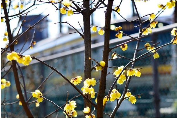
「ロウバイと南武線(2)」 古川 義則 町田堀緑地(幸区塚越)