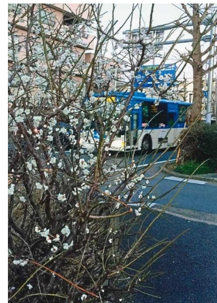
「梅の中に行く市営バス」 石村 真 幸区紺屋町・府中街道