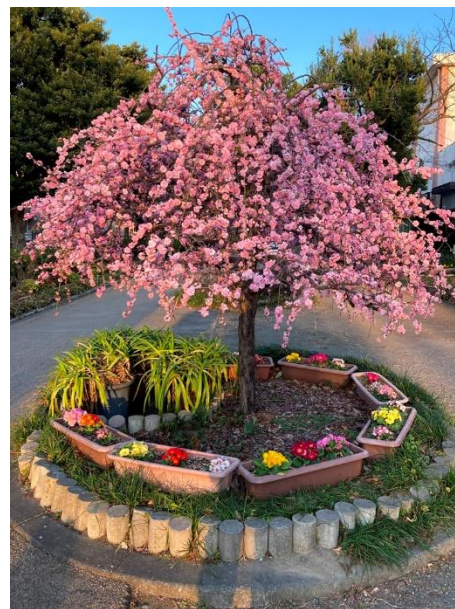
「梅の傘」 三井 璋太郎 南河原緑道