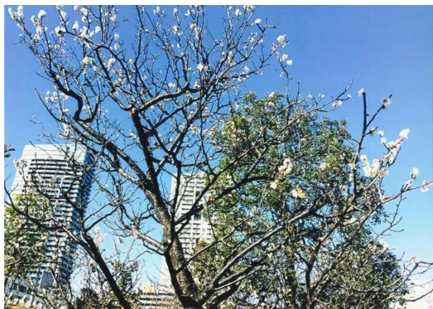
「幸通りの梅」 石村 真 幸区堀川町