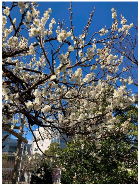
「無題(1)」 三井 璋太郎 塚越3丁目さくらの公園