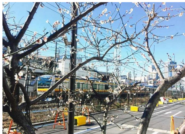
「春の南武線」 石村 真 幸区塚越