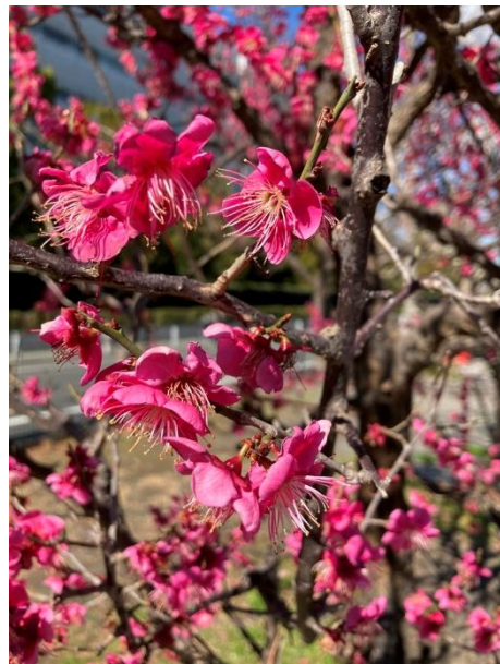
「無題(2)」 三井 璋太郎 塚越3丁目さくらの公園