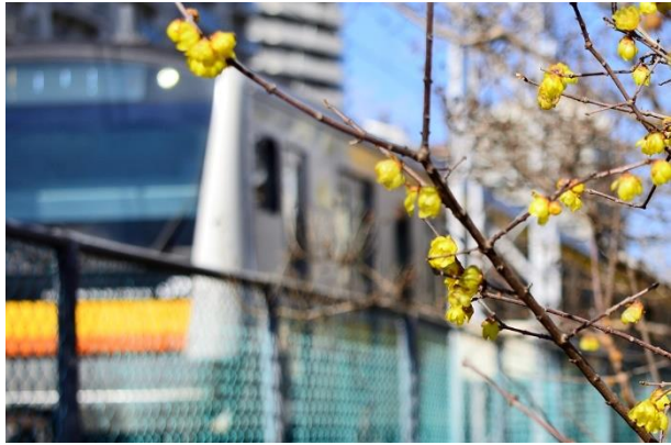
「ロウバイと南武線(1)」 古川 義則 町田堀緑地(幸区塚越)