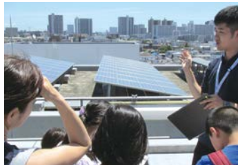
屋上にある太陽光パネル