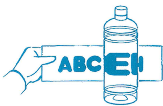
小さいペットボトルは…？