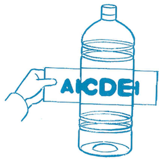
見え方を比べます。 大きいペットボトルは…？