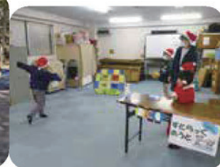
塚越4丁目母親クラブ