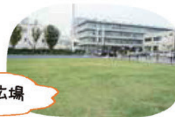
区役所前ゆめ広場