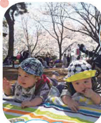
コトニアガーデンから動物公園へ！