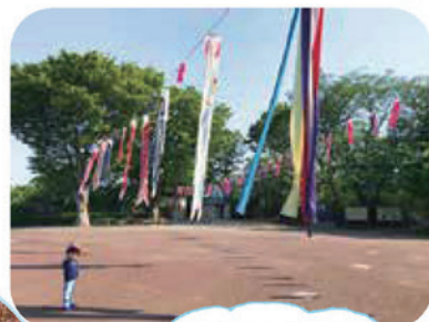
季節を感じるスポットいっぱい