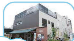
子ども連れに優しい設備！