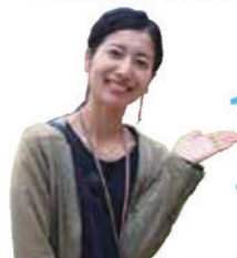
おいしいパン屋さんも紹介していきます