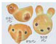
これまでに販売された創作パン