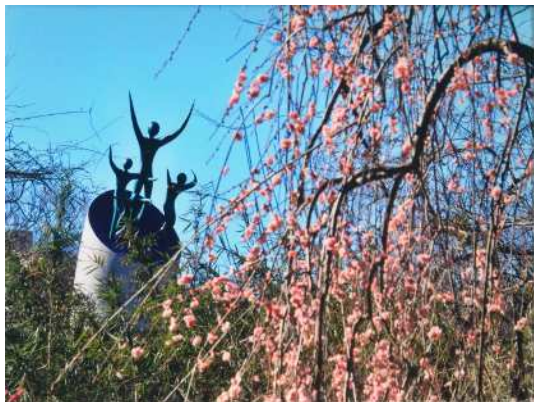
「梅花と母の塔」 本橋 新吾 生田緑地