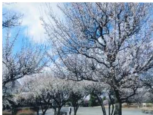
「雲のいたずら」 岡部 ふみ子 久地公園