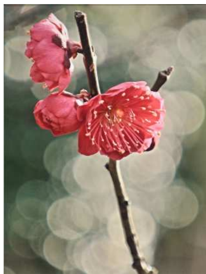
「木漏れ日と梅花」 本橋 新吾 等々力緑地