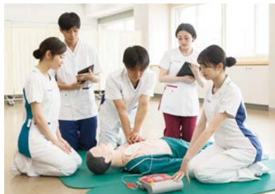
▲看護大学看護師養成の様子

「地域住民との協力体制を構築し、社会資源を活用した教育」という大学の教育理念を踏まえ、区としても、さまざまな事業と連携した取り組みを検討しています。