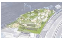
▲「グリーンアートシアター(仮称)」のイメージ

5年春に開業予定のエンターテインメントホール「グリーンアートシアター(仮称)」など、川崎駅西口を中心に多様な地域資源が生まれています。