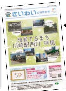
詳細は2月に発行した広報特別号で!

「ミューザ川崎」をはじめとした多様な事業者と連携しながら、地域資源を生かした魅力あふれるまちづくりを進め、地域への愛着や誇りを醸成します。