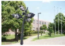
▲慶應義塾大学新川崎タウンキャンパス

慶應義塾大学新川崎タウンキャンパスやかわさき新産業創造センター(KBIC)において、川崎発のイノベーションが生まれています。