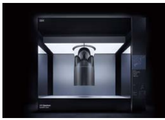
▲量子コンピューター IBM Quantum System One_Kawasaki