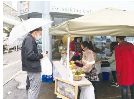
2021年のジョブまるキッズの様子