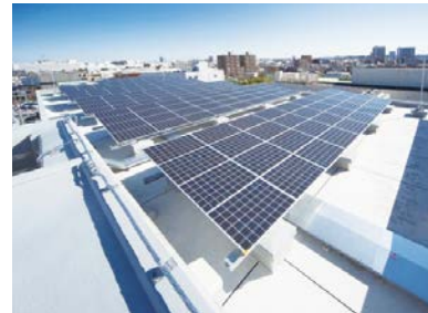
屋上にある太陽光パネル