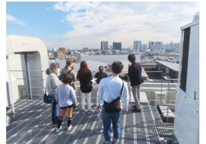
昨年度のツアーの様子