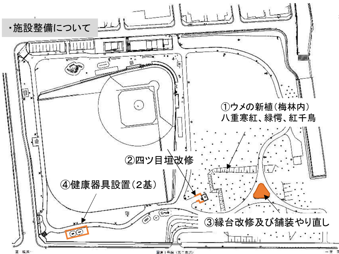
表 梅林内樹木数(令和4年度新植10本を含む) 単位:本