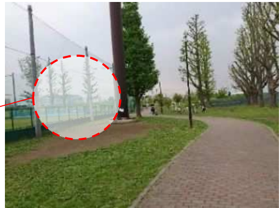
バスケットゴール設置箇所 写真