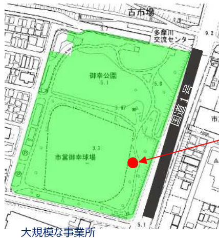
バスケットゴール設置箇所 平面図