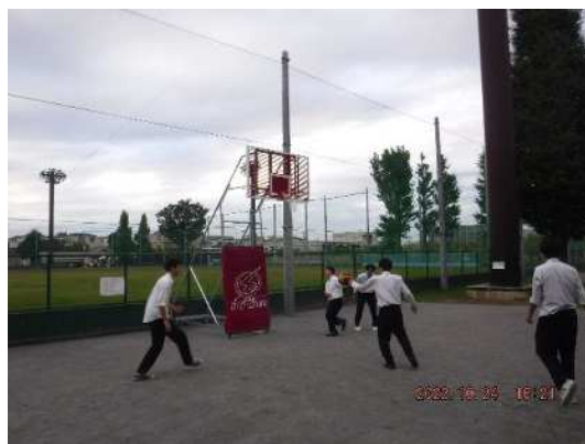
バスケットゴール設置後 写真