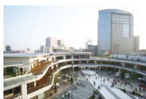
平成18年のラゾーナ川崎プラザ

平成16年にミュージアム川崎シンフォニーホールが開館し、平成18年にラゾーナ川崎プラザがオープンしました。その後、東芝未来科学館やKAWASAKI DELTAなどが完成し、新しい川崎の玄関口としてのまちづくりが進められています。