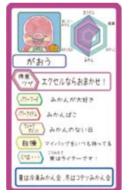
オリジナル名刺「ユメカ」