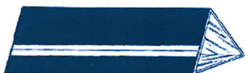
100円ミラー万華鏡（まんげきょう）の完成！