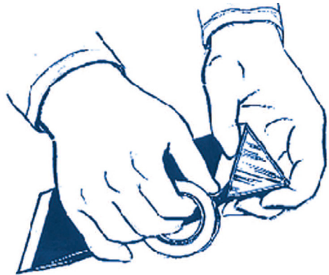
全体を黒い紙で2～3回巻き、テープで止めます。