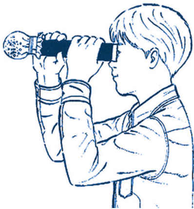
周りの景色を見てみよう。