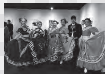
▲ポリビアのダンス