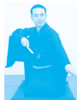
金原亭 馬治 師匠

経済成長率や識字率が世界トップレベルにまで発展した江戸時代。その頃の落語から個性的な人々が生き活きと描かれた当時の暮らしをのぞいてみませんか。そして、現代の私たちの一人ひとりが輝いて生きるためのヒントを探してみませんか。