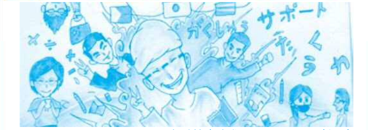
イラスト/青丘社多文化フリースクール(タイ)

日時 2月28日(木) 14:00~16:30 会場 高津市民館 大会議室 対象 外国につながる子どもの学習サポート(支援)を地域や学校の中ですすめる市民・団体、日本語指導等協力者、教員、関心のある方 定員 100人 受講料 無料 申込 申込み受付中【定員になり次第締切】 主催 川崎市、川崎市教育委員会、社団福祉法人青丘社(ふれあい館)、多文化活動連絡協議会 協力 公益財団法人川崎市国際交流協会、認定NPO法人教育活動総合サポートセンター