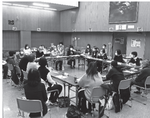
昨年度生涯学習交流集会の様子