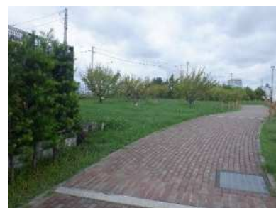
梅林内 ロープ柵がついていない箇所