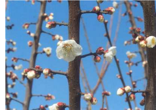
「淑やかに(白加賀)」 東川 禎男