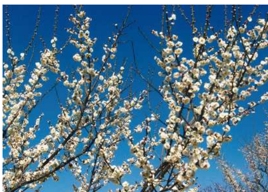
「青い空に白の梅」 小林 紀美枝