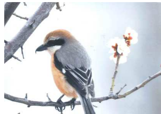
「共存」 山形 夢海