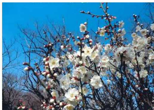
「白梅と青い空」 小池 漣