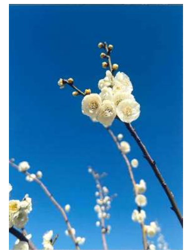
「梅と青空」 高岡 里織