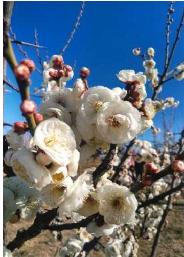
「梅のほころび雪の白梅」 帯川 順吾