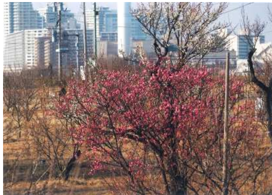
「都会の梅」 高木 尚