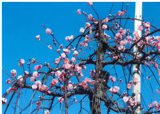
「紅梅と青い空」 小池 漣