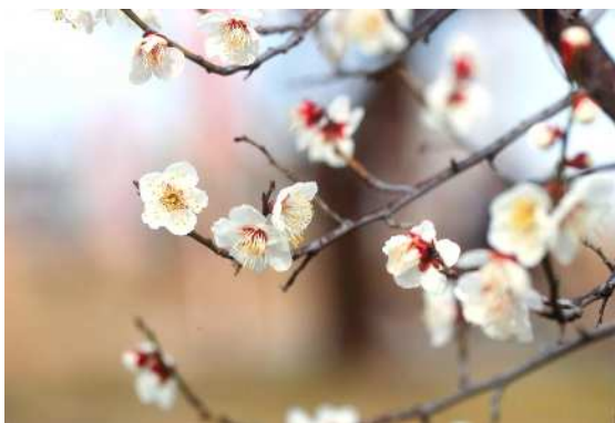
「お気に入りには南高梅」