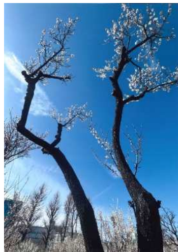
「北斗星のように空高く」