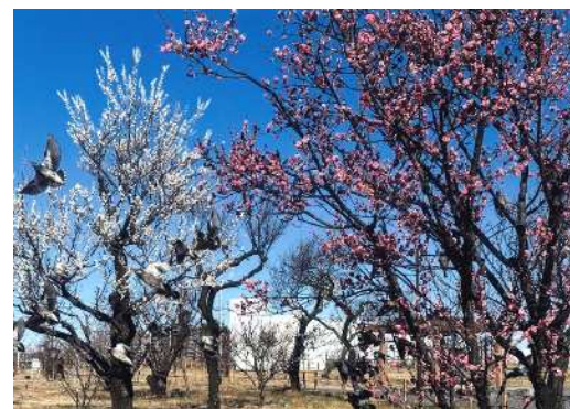
「椋鳥飛び立つ梅園」