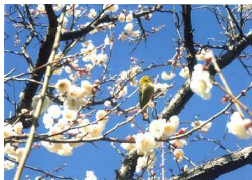
「おなかいっぱいで一休み」 高野 裕昭