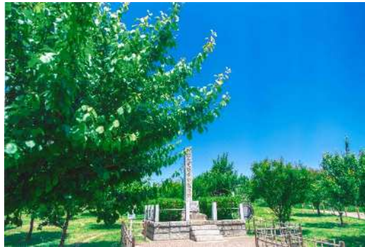
「新緑の御幸公園」 渡辺 和也