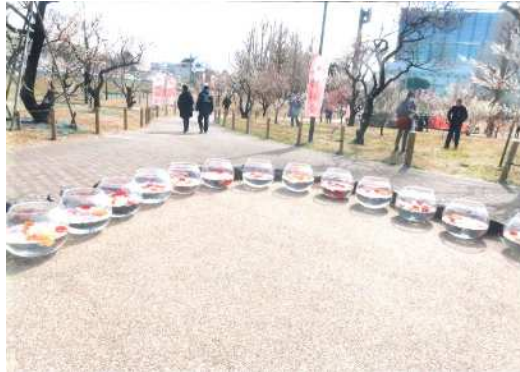
「ナイスプロムナード」 東川 禎男