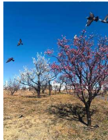
「鳩飛ぶ早春の梅園」