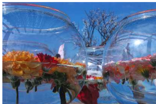
「周りの世界」 真貝 憲一