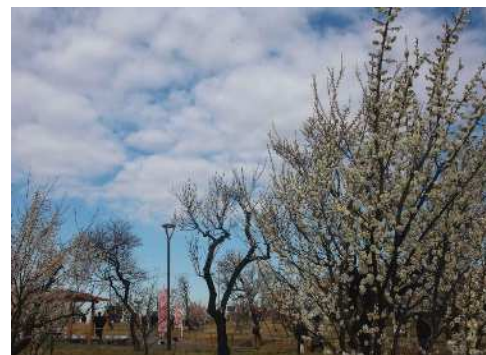
「雲をしたがえて」 真貝 憲一