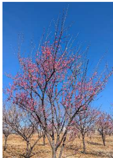
「青空と、咲き始めた梅」 本郷 明美