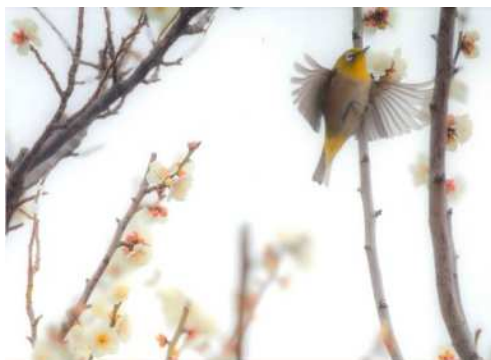
「羽ばたき」 有賀 雄一郎