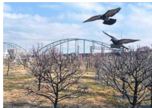
「育てよ 若い梅木たち」