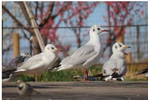
「ならんでならんで」