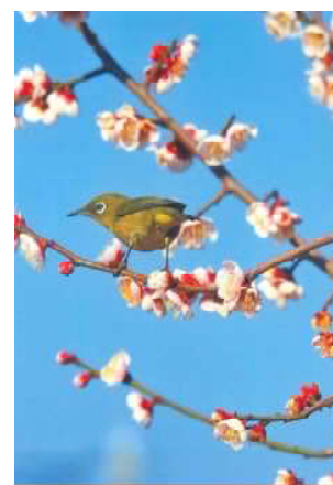
「ぴよこん、と春」 山形 夢海