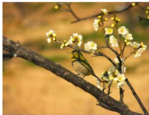
「マスクマン」 真貝 憲一