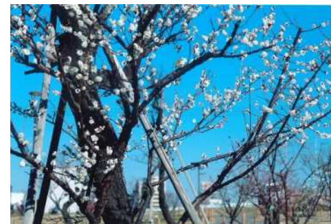
「春日(はるひ)のうめ」