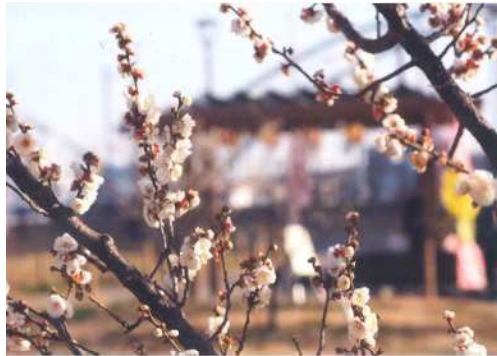
「早春の光」 田中 修平