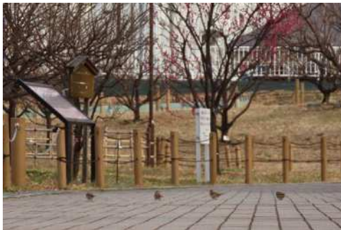
「香梅園に御幸のビートルズ？」