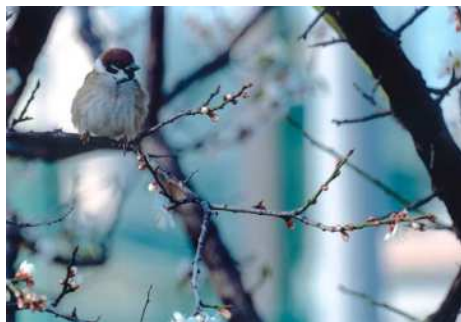
「春隣(はるとなり)の日」