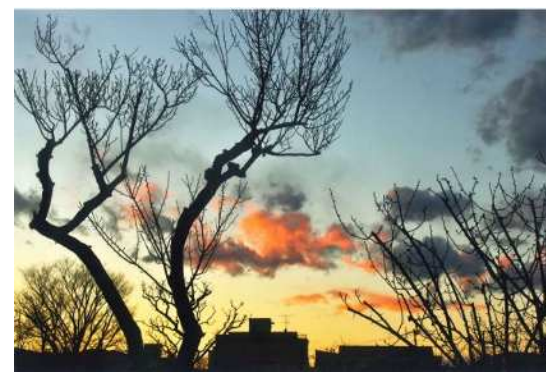
「御幸夕景」 真貝 憲一