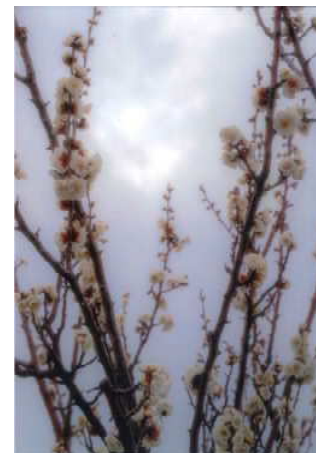
「くもり空」 有賀 雄一郎