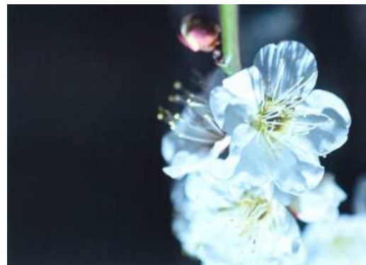
「スポットライトで光る梅」 小林 祐司