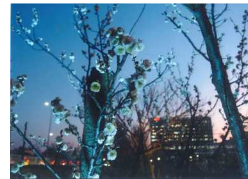
「仕事後の癒し」 川島 啓一