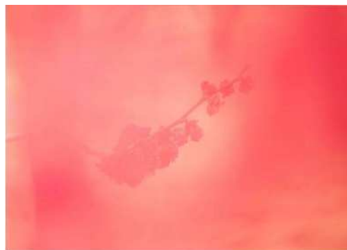
「ウメの夢」 有賀 雄一郎