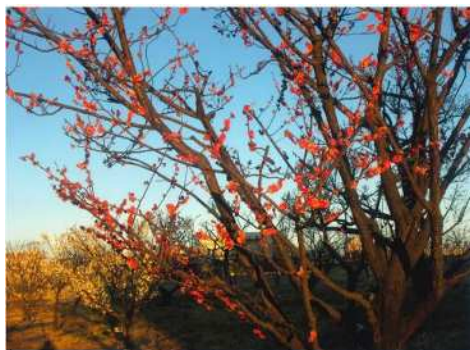
「私はここに」 真貝 憲一