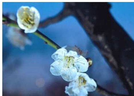
「黄昏のライトアップ」 小坂 恭範