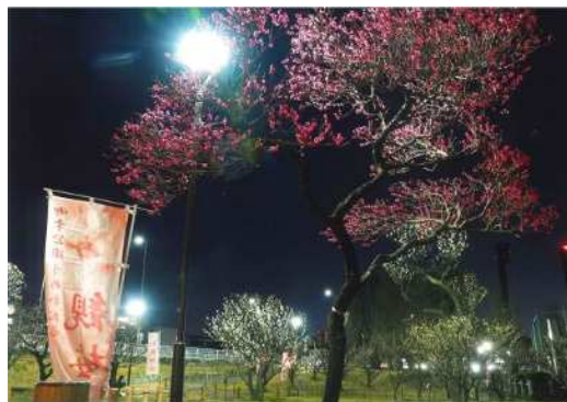
「夜の梅林」 堀内 たえ子