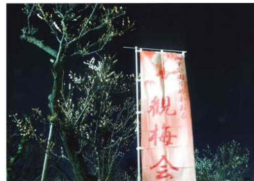
「夜の梅林」 堀内 たえ子